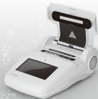
Genelyzer FII Genelyzer FIII

キャノンメディカルシステムズ株式会社 https://jp.medical.canon